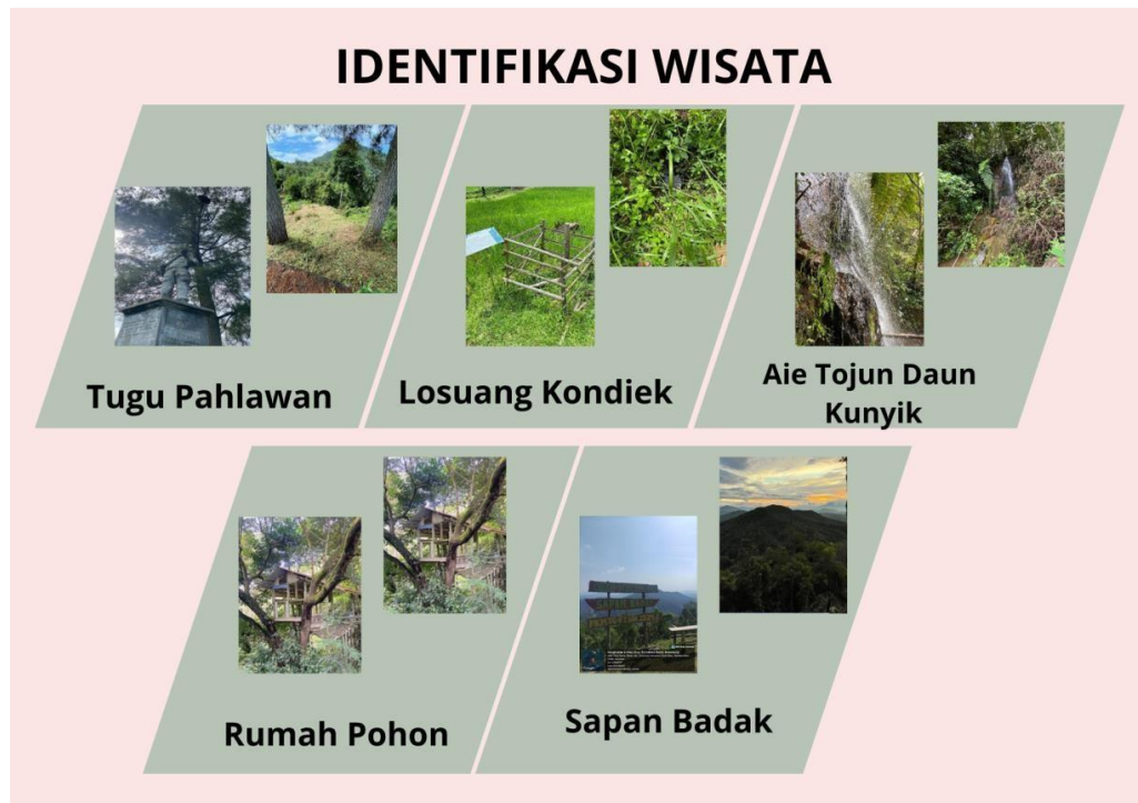
Gambar 1. Identifikasi Wisata

Desa Tumpuk Tengah adalah sebuah desa yang terletak di Kecamatan Talawi, Kota Sawahlunto, Sumatera Barat. Desa ini memiliki potensi wisata yang menarik dengan pemandangan alam yang indah, warisan geologi yang unik, dan budaya lokal yang masih terjaga. Pengembangan pariwisata di Desa Pintu Angin dan Bonou diawali dengan kunjungan ke Sapan Badak, dan membuat video profil serta mempromosikan video profil wisata tersebut ke media sosial, sebagai bagian dari upaya pengembangan potensi pariwisata di Desa Pintu Angin dan Bonou, dilakukan inisiatif untuk menyoroti keindahan alam, kekayaan budaya dan potensi wisata yang dimiliki oleh Desa Pintu Angin dan Bonou, selain itu upaya dari tim KKN juga memperindah dan mempercantik taman yang berada Desa Pintu Angin dan Bonou, Tujuannya Desa Pintu Angin dan Bonou adalah untuk menjadikan nagari Andiang sebagai destinasi wisata yang terkenal secara luas, dengan pertumbuhan yang berkelanjutan dan bermanfaat langsung bagi masyarakat setempat.