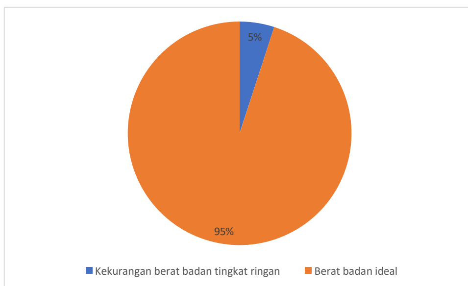
Gambar 1. Diagram Total Persentase Hasil Pengukuran IMT