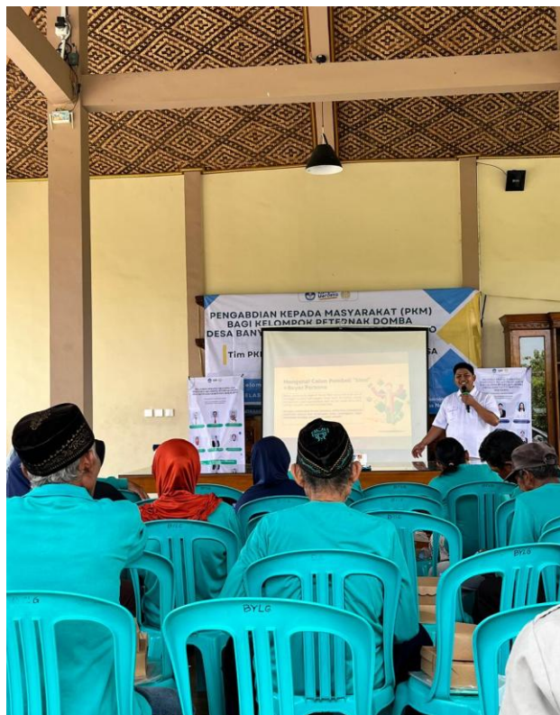
Gambar 4: Pelaksanaan pelatihan