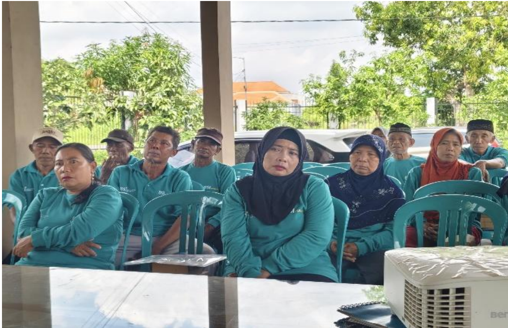
Gambar 3. Peserta pelatihan dengan antusias mengikuti kegiatan pelatihan