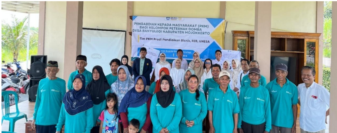
Gambar 8. Tim Pengabdian kepada Masyarakat di Desa Banyulegi

terkait pemasaran digital melalui media sosial whatsapp, facebook, Instagram, dan tiktok yang sangat baik setelah pelatihan. Tim PkM melakukan evaluasi pada peserta dengan membandingkan reaksi, umpan balik maupun keaktifan peserta sebelum dan setelah kegiatan pelatihan dilakukan. Hasil evaluasi setelah pelatihan menunjukkan bahwa sebagian besar peserta sudah memahami cara membuat konten digital marketing menggunakan aplikasi media sosial seperti whatsapp, instagram, facebook hingga tiktok. Selain itu, mereka menunjukkan keinginan untuk menggunakan media sosial ini dalam proses pemasaran ternak domba mereka. Hasil pelatihan tersebut selaras dengan tujuan tim pengabdian yaitu untuk meningkatkan keberdayaan mitra, yang berarti meningkatkan pengetahuan, kemampuan, dan layanan untuk kegiatan pemasaran secara digital.