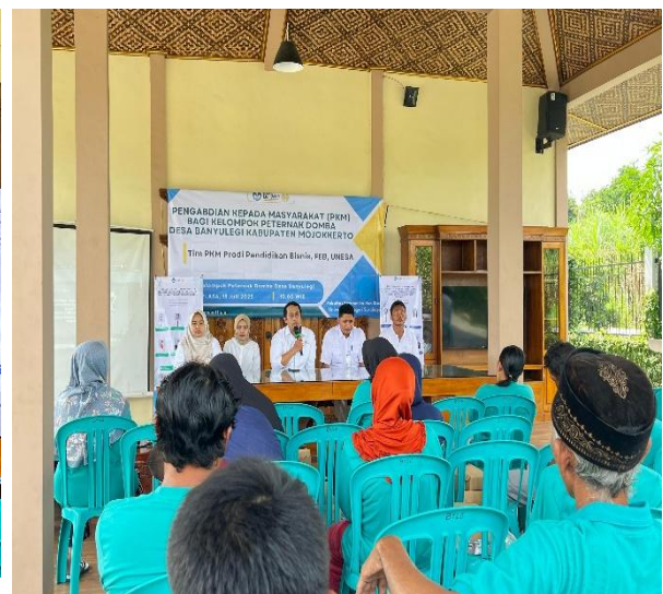
Gambar 2. Kegiatan Pelatihan oleh Tim PkM