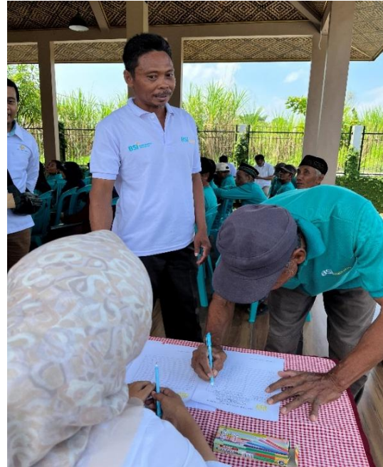
Gambar 1. Para peternak domba mengikuti mengikuti pelatihan dan mengisi daftar hadir