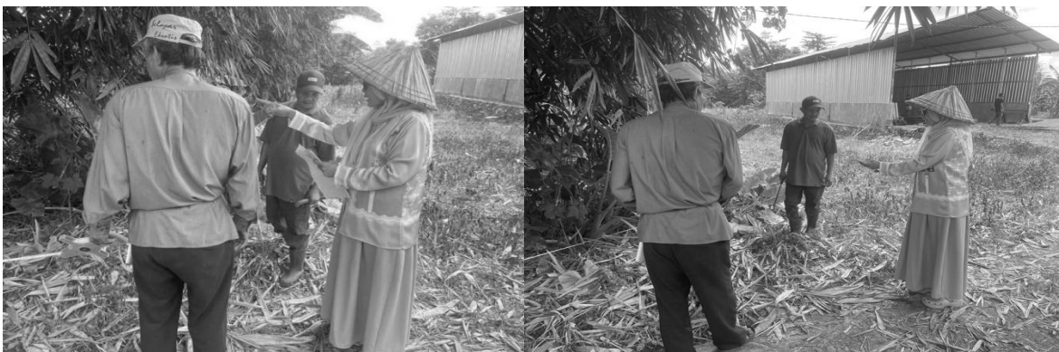
Gambar 2. Dokumentasi Kegiatan Pengabdian

Secara keseluruhan, kegiatan pengabdian ini memberikan dampak yang signifikan terhadap peningkatan pengetahuan, keterampilan, dan kesadaran pelaku usaha dalam mengelola keuangan secara digital. Pendekatan yang dilakukan melalui kombinasi penyuluhan, pelatihan, dan pendampingan terbukti efektif dalam mendorong perubahan perilaku pelaku usaha menuju sistem pengelolaan usaha yang lebih modern dan efisien. Namun demikian, keberhasilan kegiatan ini masih memerlukan dukungan berkelanjutan, baik dari pemerintah daerah maupun pihak terkait lainnya, agar pelaku usaha dapat terus mengembangkan kemampuan dan memanfaatkan teknologi digital secara optimal. Dengan adanya pendampingan yang berkelanjutan, diharapkan pelaku usaha mikro dan kecil di Kecamatan Pattallassang dapat meningkatkan daya saing serta berkontribusi lebih besar terhadap perekonomian daerah.