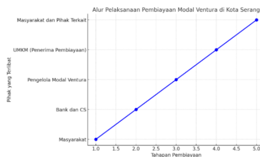
Grafik 1. Alur Pelaksanaan Pembiayaan Modal Ventura di Kota Serang

Dalam hal inovasi dan kapasitas produksi, modal ventura memungkinkan UMKM untuk memperluas kapasitas produksi dan berinovasi dalam produk dan layanan mereka. Pembiayaan ini memberikan dana yang diperlukan untuk meningkatkan teknologi dan proses produksi, yang berpotensi meningkatkan kualitas produk dan daya saing di pasar. Namun, tidak semua UMKM memiliki kesiapan untuk mengelola pertumbuhan yang pesat. Banyak dari mereka yang belum memiliki kemampuan atau struktur organisasi yang cukup untuk menghadapi tantangan yang datang dengan ekspansi usaha. Jika pertumbuhan usaha tidak dikelola dengan baik, hal ini bisa berujung pada masalah internal seperti kelebihan produksi, kesulitan dalam memenuhi permintaan, atau ketidakmampuan dalam menjaga kualitas produk. Terakhir, pembiayaan modal ventura berperan penting dalam meningkatkan keberlanjutan usaha UMKM. Dengan memberikan dana untuk ekspansi dan pengembangan produk, modal ventura membantu UMKM untuk bertahan dan berkembang lebih lama di pasar yang kompetitif. Namun, meskipun pembiayaan ini meningkatkan peluang untuk bertahan, risiko kegagalan usaha tetap ada. Kegagalan dalam mengelola pertumbuhan atau kegagalan dalam menghadapi perubahan pasar bisa menyebabkan usaha UMKM tetap terancam. Oleh karena itu, meskipun pembiayaan modal ventura memberikan peluang yang besar untuk memperpanjang umur usaha, faktor pengelolaan dan kesiapan usaha tetap menjadi penentu utama dalam keberlanjutan usaha jangka panjang.